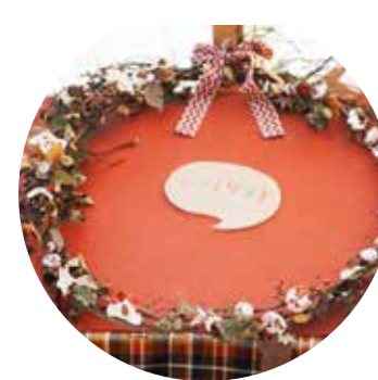
押し葉と紙粘土のリース