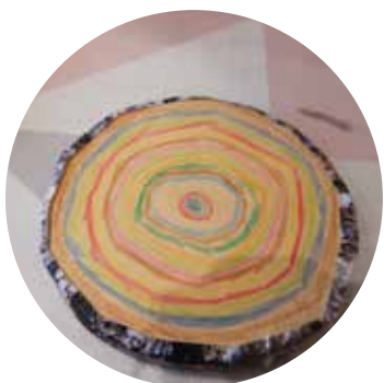
年輪を観察して描く