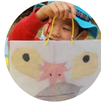
葉っぱバッグを作って遊ぶ