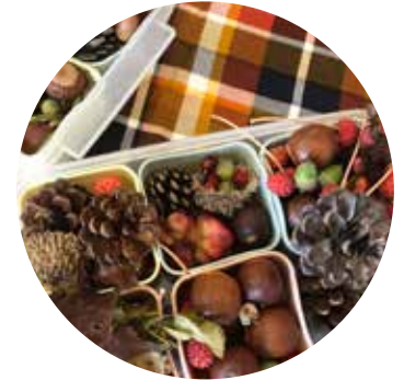
木の実を容器につめる