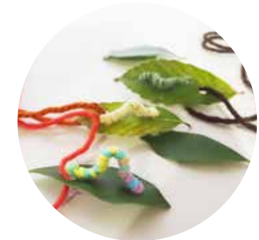
穴あき葉っぱのペンダント