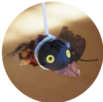
押し葉をちぎってはる