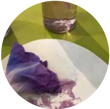
お水に草花を浮かべる