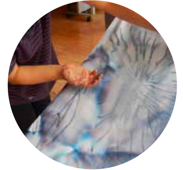
お水でにじみ絵あそび