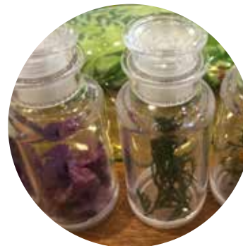
花や木の実を乾燥させる