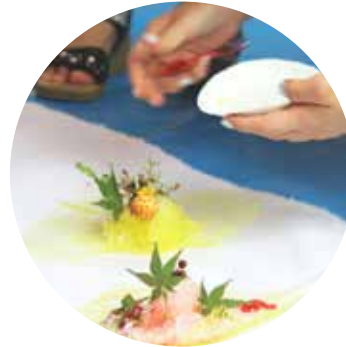
くさばなかき氷をつくる