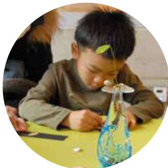
根っこをスケッチする