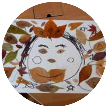
押し葉でお絵描きする