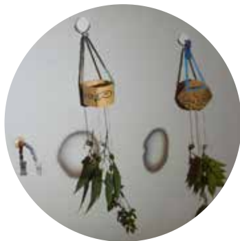
木の実を乾燥させる