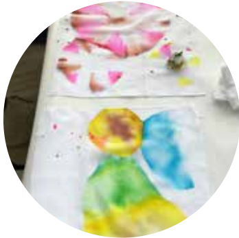
こおりでにじませる