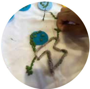
くっつきむしで遊ぶ