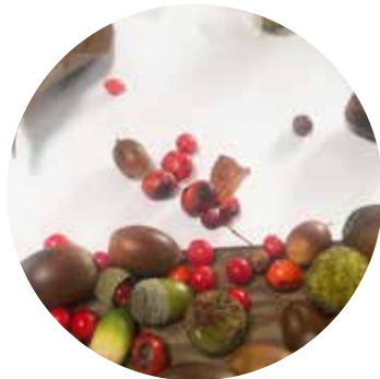
集めた木の実を並べる