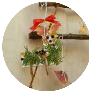
押し葉でかざりをつくる