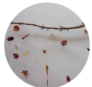
葉っぱをロウでコーティングする