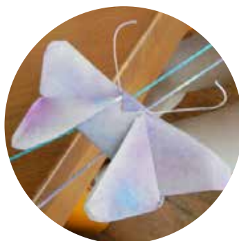
ぼかし絵をして遊ぶ