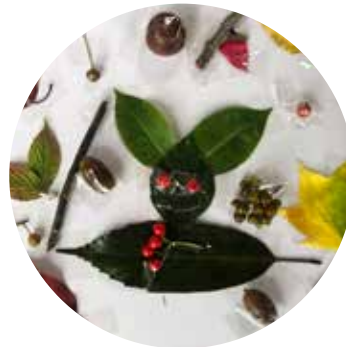
木の実や葉っぱで絵を描く