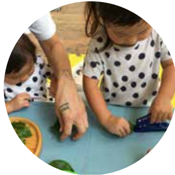
葉っぱに穴をあける