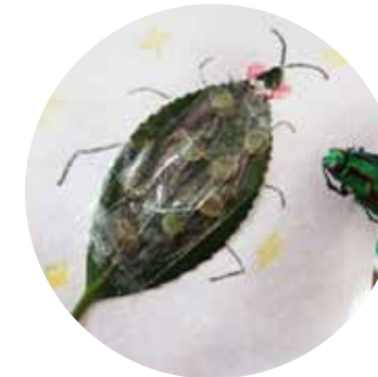
穴あき葉っぱでお絵描き