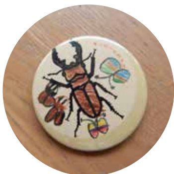
ぬり絵缶バッジをつくる